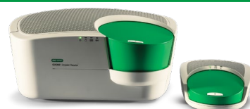
“ QX200 Droplet Digital PCR システム ”